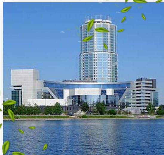
Ельцин Центр» и деловой дом «Демидов», 2017 год город Екатеринбург

В прошлом учебном году мы посетили «Ельцин Центр», общественный, культурный и образовательный центр, открытый в Екатеринбурге в 2015 году. Нам очень понравилась экскурсия по главному объекту центра - Музею Бориса Ельцина, посвящённому современной политической истории России и личности первого президента России. Музей состоит из 9 залов: 1. Лабиринт — история России с 1914 по 1987 год и история семьи Ельциных; 2. День первый. «Мы ждем перемен!»; 3. День второй. Августовский путч; 4. День третий. Непопулярные меры; 5. День четвертый. Рождение Конституции; 6. День пятый. «Голосуй или проиграешь»; 7. День шестой. Президентский марафон; 8. День седьмой. Прощание с Кремлем; 9. Зал Свободы. Также в центре функционируют арт-галерея, кино-конференц зал, книжный магазин, кафе, архив, библиотека, парк научных развлечений, коворкинг. На площадках центра регулярно проводятся лекции, концерты, выставки, фестивали и различные общественные мероприятия. В кинозале ведёт работу центр документального кино. Также мы узнали, что в центре периодически проводятся различные кинофестивали: фестиваль российского документального кино «Артдокфест», Первый Уральский открытый фестиваль российского кино, фестиваль фильмов о музыке и новой культуре «Beat Weekend». Поездка в «Ельцин- Центр» была очень познавательной!