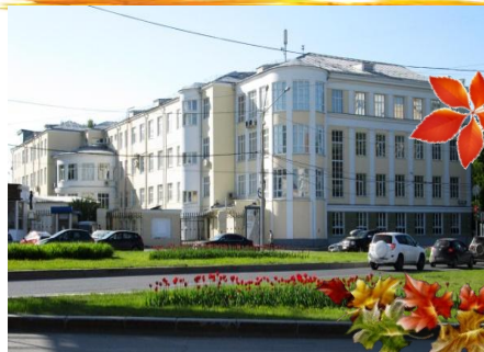
Уральский государственный медицинский университет

Пролетело лето, начался новый учебный год. Самое время вспомнить о наших выпускниках. Где они? Куда поступили? Вот что они рассказывают про свои новые учебные заведения.